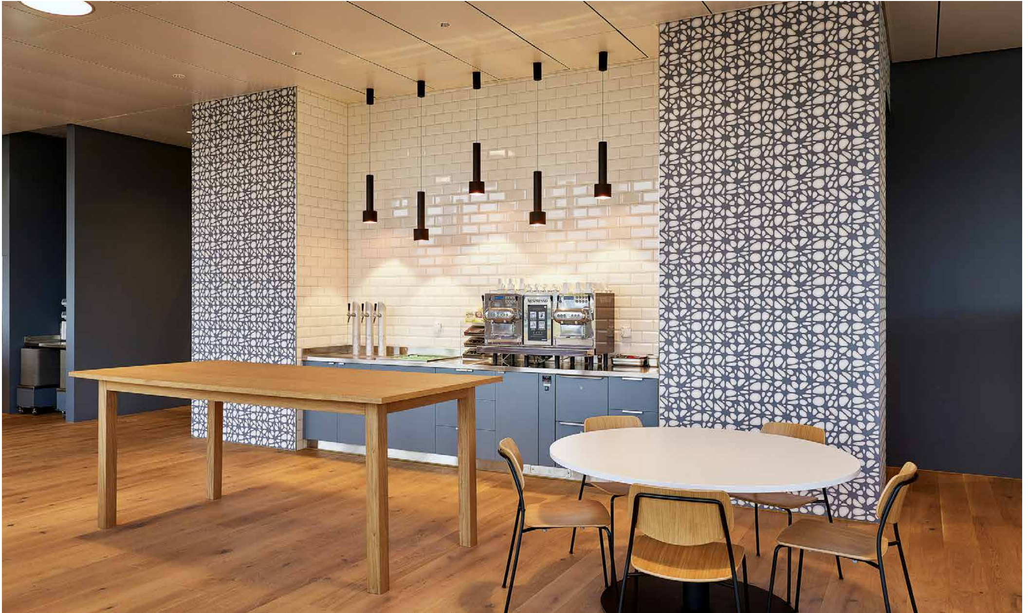
Innenarchitektur: Objekt 13